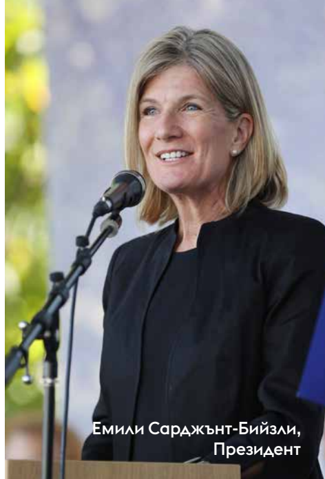
Емили Сарджънт-Бийзли, Президент